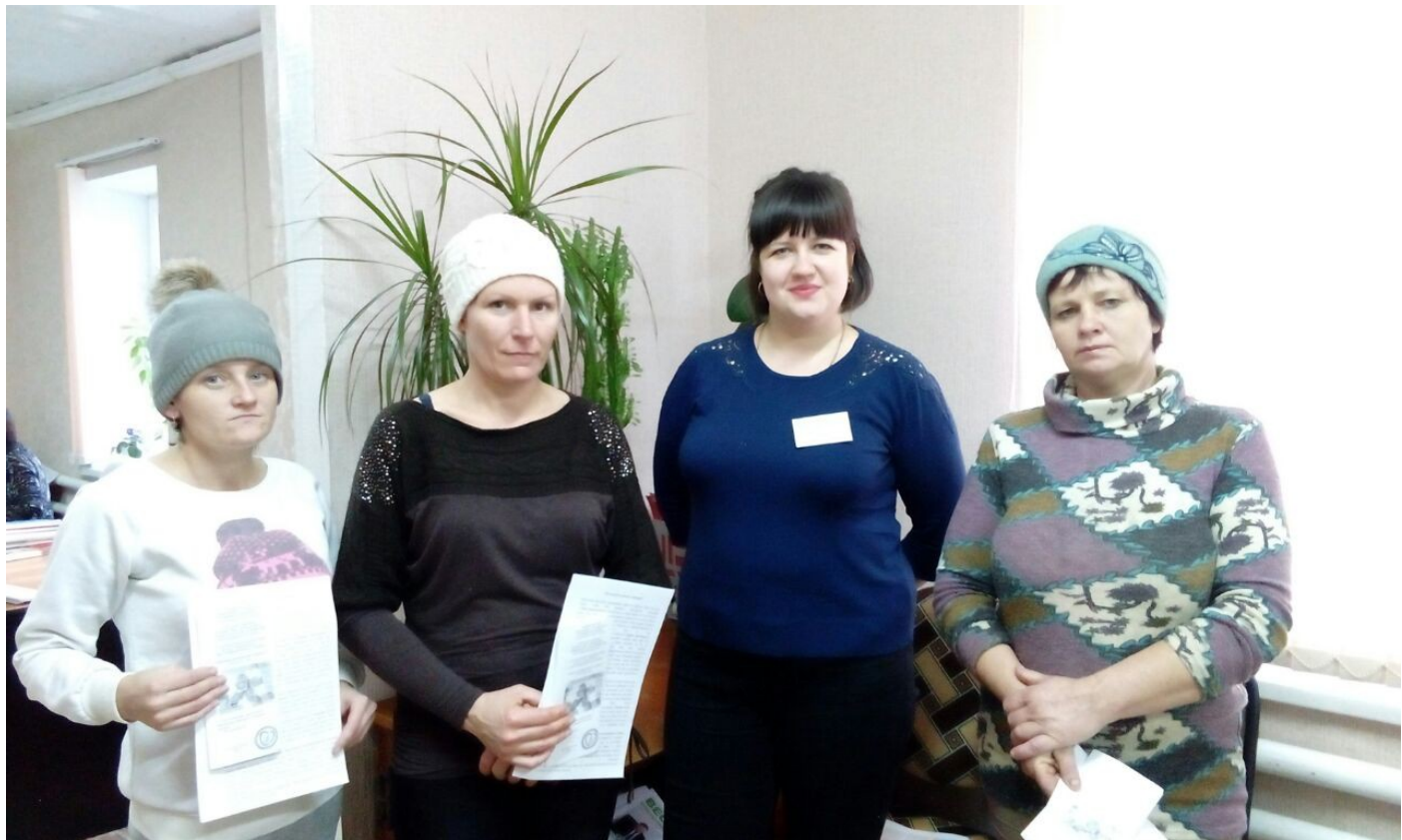
01 декабря 2017 года в библиотеке сельского поселения пос. Октябрьского в Среднечелбасском сельском поселении состоялось мероприятие, посвященное Всемирному Дню борьбы со СПИДом.